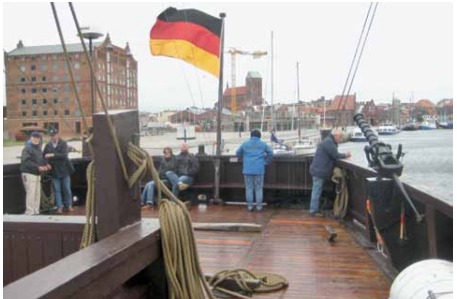
24. Juli 2011: Die „Wisse Mara“ läuft aus dem Wismar Hafen

tigem Westwind vom geschützten Bereich unter dem Kastell oder der zügigen Plane anschauen, sonst wäre man durchnässt bis auf die Haut.