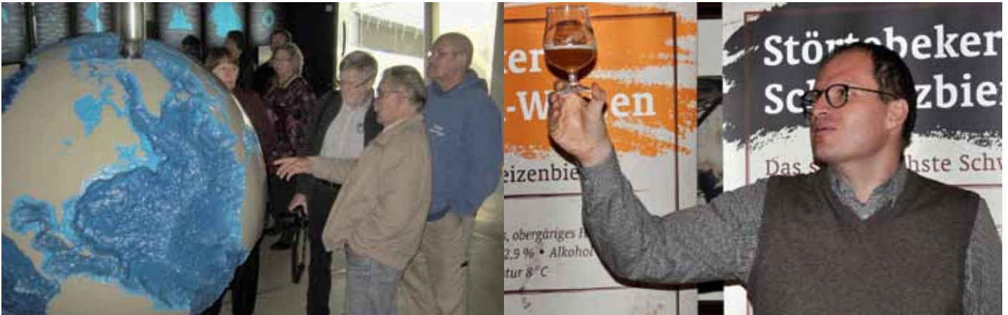
Unser „Kuddel“ im Ozeaneum: „Hier war ich auch schon!“