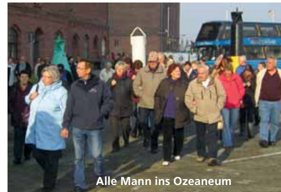
Alle Mann ins Ozeaneum

Die nächste Station unserer Tour war die Stralsunder Brauerei mit dem uns bekannten Störtebekerbier. Koggen und Brauereien waren schon immer eng verbunden, denn Bier war der Exportartikel der Hansezeit und die Koggen die Bierlastesel. Seit diesem Jahr gibt es nun