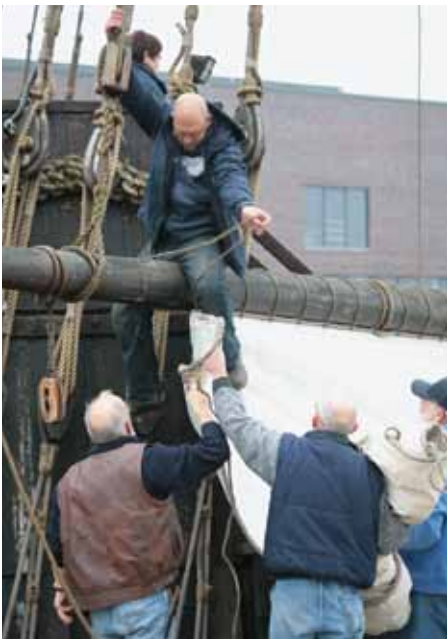
Unser „Bernd“ auf der Rah beim Abschlagen des Hauptsegels

Abtakeln heißt auch, dem Segelschiff seiner Segel sowie dem laufenden und stehenden Gut zu berauben. Und wie sieht alles nach dem Abtakeln aus? Erst einmal traurig und auf alle Fälle ist das Schiff nicht mehr so stolz und schön. Etwas Wehmut beschleicht dann schon die Seemannsseele. Aber es ist ja auch die Zeit bis zum Auftakeln, alles wieder in Ordnung zu bringen und die Seemannsbraut – das Schiff ist hier gemeint