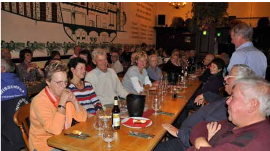
In der Brauerei: Verprobung der „Störtebeker“-Bierspezialitäten

auch den Partnerschaftsvertrag zwischen der Stralsunder Brauerei GmbH und unserem Förderverein.